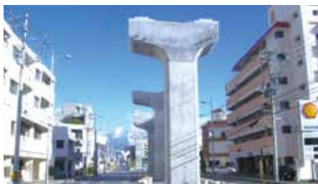
都市モノレール下部工事