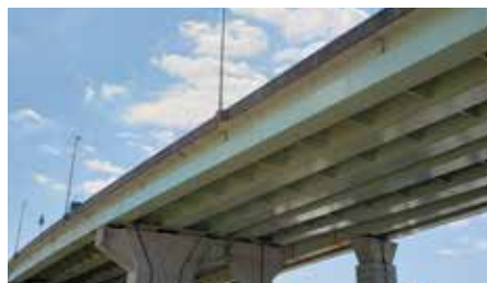
宮城高架橋塗装工事