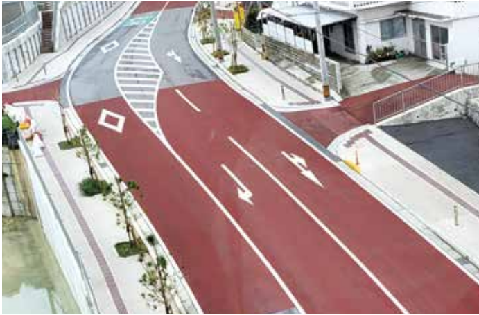
すべり止め設置工事