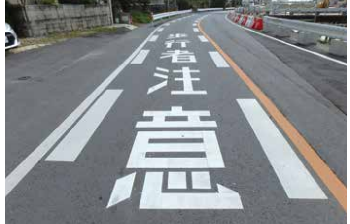
道路標示設置工事