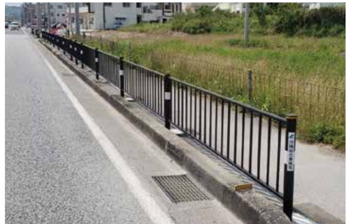
歩行者横断防止柵設置工事