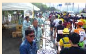
給水ボランティア (NAHAマラソン)