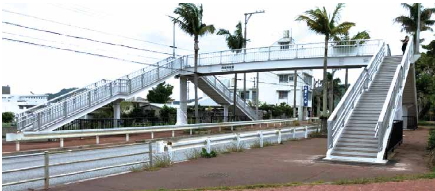
佐敷歩道橋修繕工事