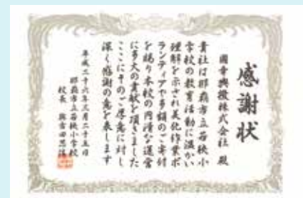
若狭小学校感謝状