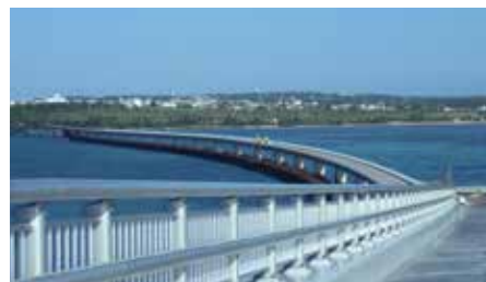
伊良部大橋高欄設置工事