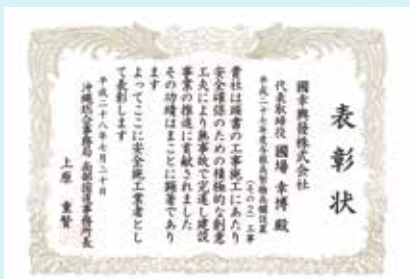
平成 27 年度与根高架橋 高欄設置 (その 2) 工事