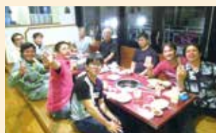
社内懇親会 (食事会)