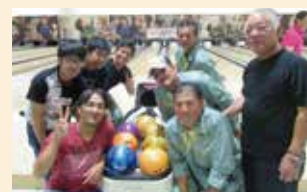
社内懇親会 (ボーリング大会)