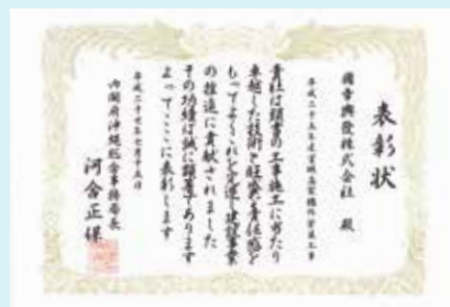
平成 25 年度 宮城高架橋外塗装工事