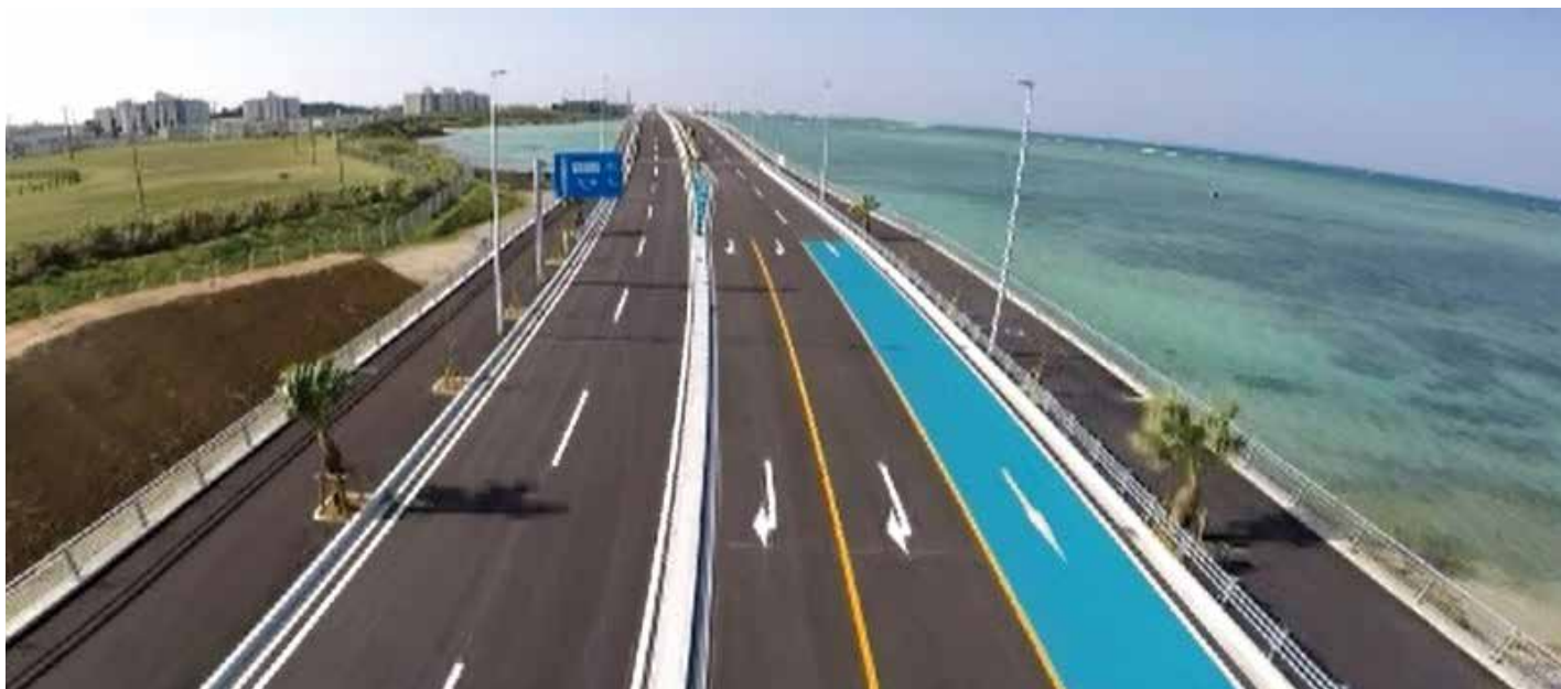
浦添臨港道路改良工事