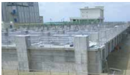
浄化槽沈殿池築造工事