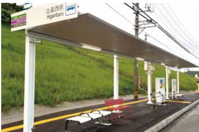
バス停上屋設置工事