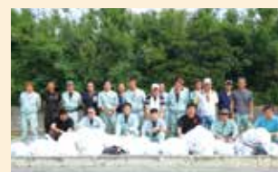
清掃ボランティア