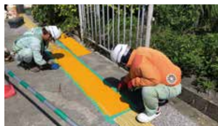
視覚障害者誘導標示シート設置工事