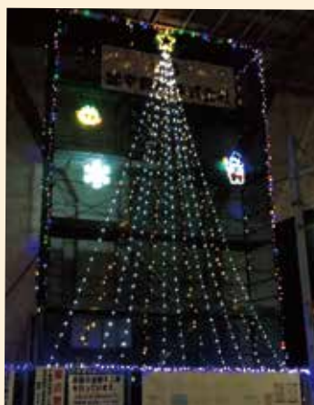
クリスマスイルミネーション