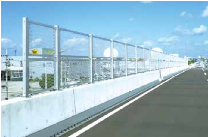
落下物防止柵設置工事