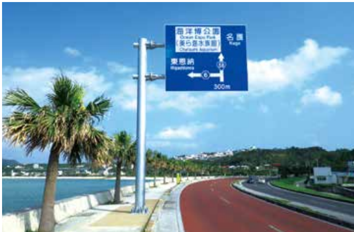
道路標識設置工事