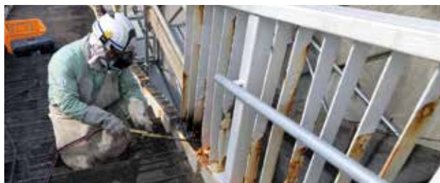
佐敷歩道橋修繕工事