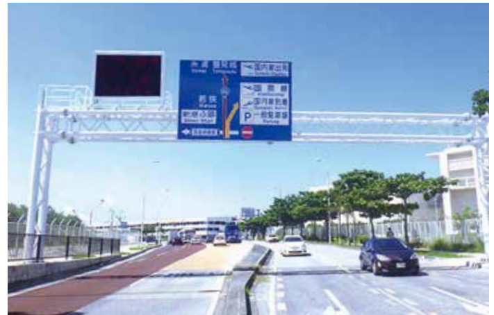
道路標識設置工事