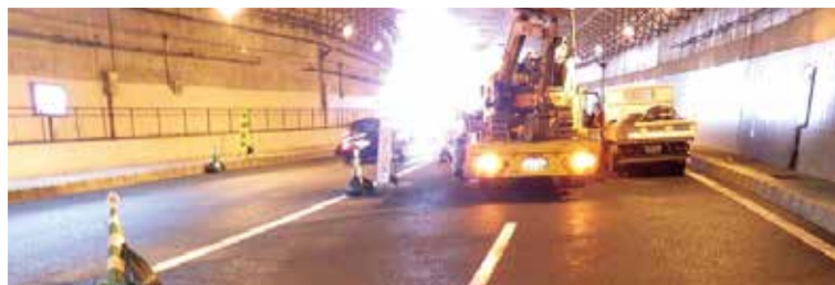
うみそらトンネル内維持工事