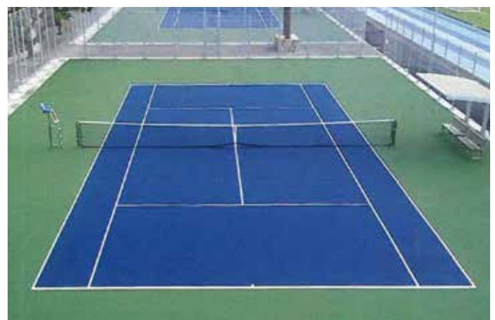
テニスコート修繕工事